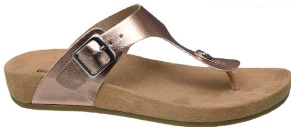
Модел 1 261 614 34,90 лв.