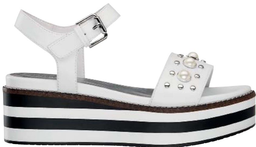
Модел 1240 938 59,90 лв.