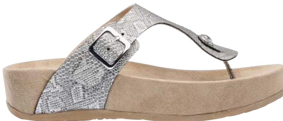
Модел 1 262 891 59,90 лв.