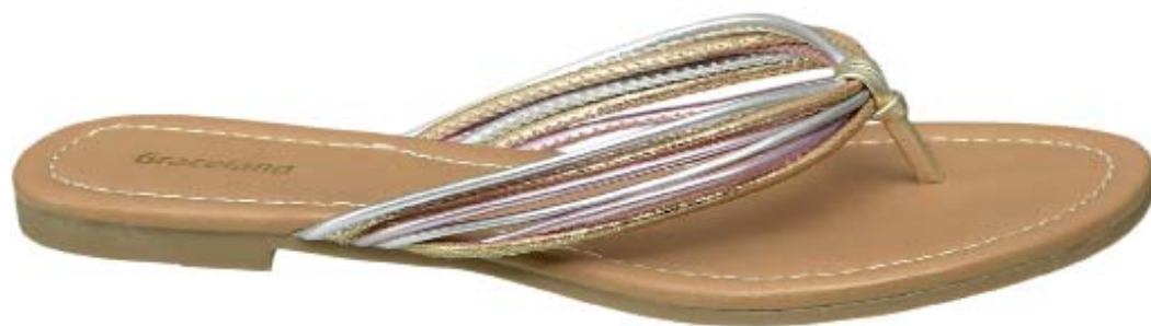
Модел 1 260 010 24,90 лв.