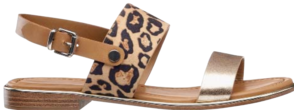
Модел 1 210 072 39,90 лв.

Време е да заложите на животинските принтове, които се съчетават перфектно и с новите любими летни модели.