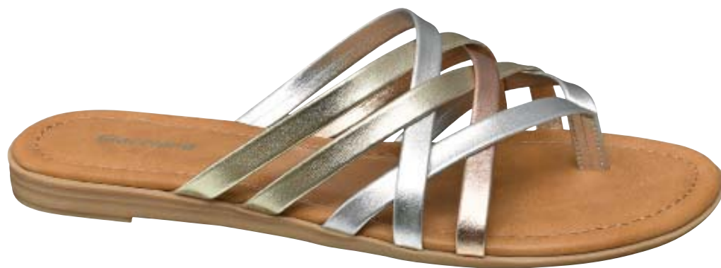
Модел 1 260 018 34,90 лв.

Шикозните равни чехли подслаждат очакването на предстоящата почивка на плажа.