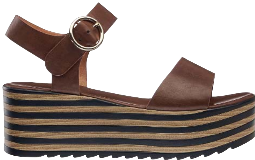
Модел 1 240 991 59,90 лв.

Раураните подметки XXL сега са топ-тренд и при сандалите.