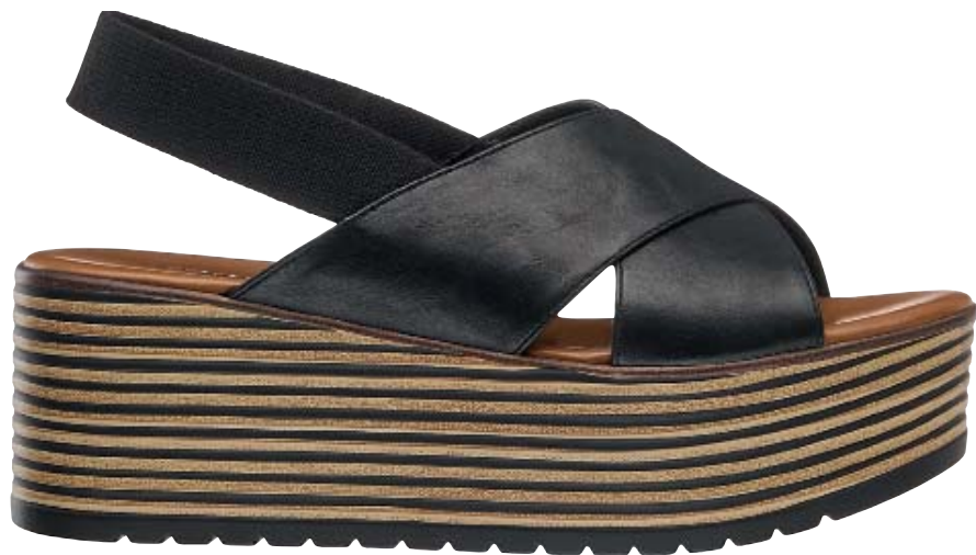
Модел 1 240 992 59,90 лв.