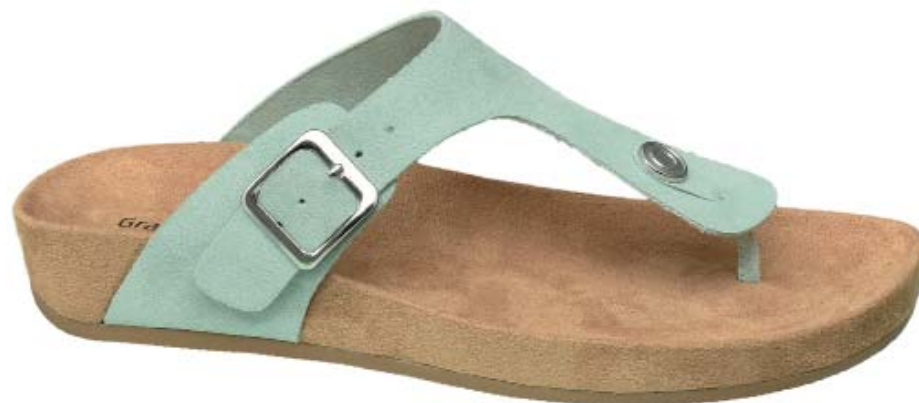
Модел 1 261 004 34,90 лв.

Супер удобни чехли за всеки ден, които създават лятно настроение не само на плажа.