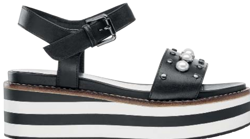
Модел 1240 939 59,90 лв.

Новите небрежни летни модели с масивна черно-бяла подметка.